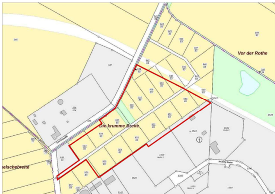
Abbildung 5: Flurkarte (Auszug aus dem Landes-/ Geoportal Sachsen-Anhalt „Sachsen-Anhalt-Viewer“) mit Kennzeichnung des Plangebietes des B-Planes „Erweiterung Biogasanlage Oebisfelde“