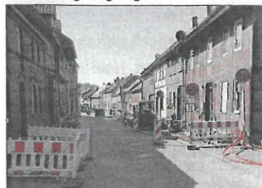
Die Tiefbauarbeiten innerhalb des Clusters 3 (Oebisfelde) werden Ende August abgeschlossen sein.

Frankenfelde) und 9 (Oebisfelde Nord, Breitenrode, Wassendorf und Buchhorst) vorzubereiten.