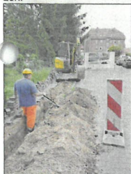
Oebisfelde-Weferlingen bzw. dem beauftragten Projektsteuerer, der MRK Media AG, und dem Netzbetreiber, der DNS:NET Internet Service GmbH, zur Prüfung vorgelegt.