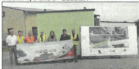
Am 19.07.2019 erfolgte die Fertigstellungsabnahme innerhalb des Clusters 1 (Rätzlingen)