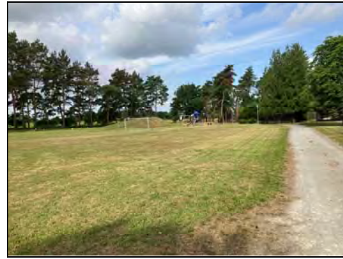
Fußball- und Spielplatz mit Rodelberg

Der mittlere Teil des Plangebietes wird intensiv als Sport- und Spielplatz genutzt. Auf dem Gelände ist eine Aufschüttung aus der Entschlammung der Badekuhle vorhanden, die als Rodelberg genutzt wird.