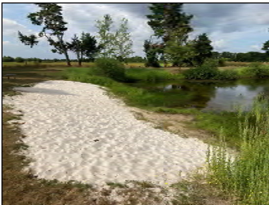
Strand an der Badekuhle

Das Plangebiet wird durch eine Vielzahl von Biotoptypen geprägt, die eine unterschiedliche Bedeutung für den Naturhaushalt haben. Am Rand des Gebietes wird das Plangebiet gegenüber den angrenzenden Ackerflächen durch teilweise lückige Baumreihen und Gehölzbereiche eingegrünt. Sie bestehen überwiegend aus Birken und Kiefern, teilweise mit Weiden und Eichen durchsetzt. Aufgrund der mehrjährigen trockenen Witterungsbedingungen ist der Grundwasserspiegel der grundwasserbestimmenden Böden stark gesunken, wodurch Teile des Baumbestandes abgestorben sind. Dies betrifft insbesondere höherwertige Gehölzarten und Birken, während die Kiefern noch vital sind. Das Gebiet wird durch Gehölzbereiche in vier Abschnitte gegliedert, die Flächen der Stellplätze unmittelbar an der Straße, der sich daran anschließende Scherrasenbereich, der Fußballplatz und der Spielplatz sowie der Badebereich mit der Badekuhle.