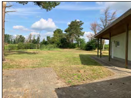
Blick zur Badekuhle

Der Bereich der Badekuhle wird durch das Gewässer geprägt. Nordwestlich des Gewässers ist ein Wall vorhanden, der offensichtlich aus Aufschüttungen der Gewässerentschlammung stammt. Im Gewässer sind kleinflächig Röhrichte vorhanden, die erhalten werden können.