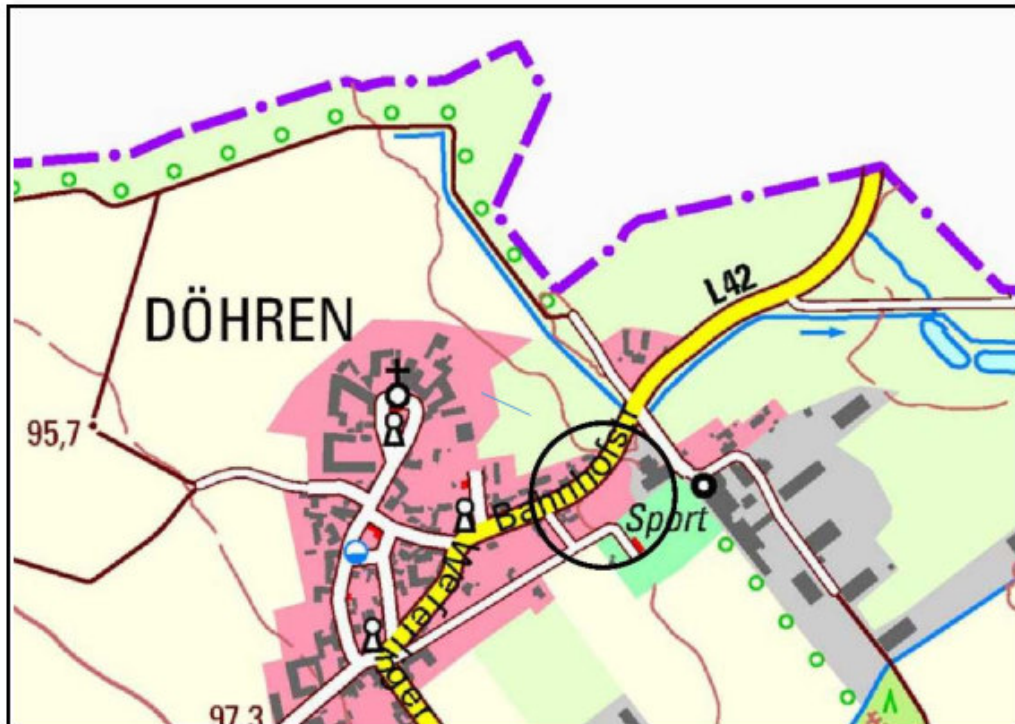
Auszug aus der topographischen Karte, Ortslage Döhren, Stadt Obisfelde - Weferlingen [TK10 11/2015]